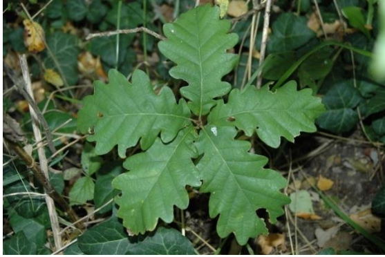
Erdészeti alapismeretek gyakorlat