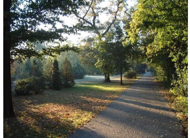
Sétány a parkban